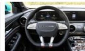
Equipamiento incluido •

Nos reservamos el derecho de actualizar, cambiar o reemplazar cualquier especificación sin previo aviso